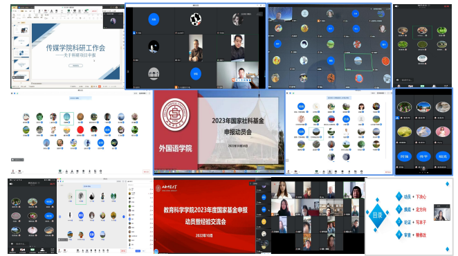
各学院线上会议召开情况